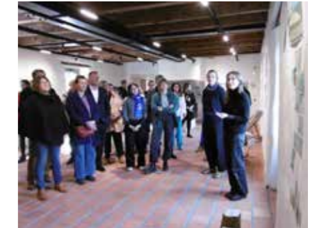
Un des étudiants expliquant la démarche au public.

Nous vous présenterons leur travail dans le prochain bulletin de juillet 2025.