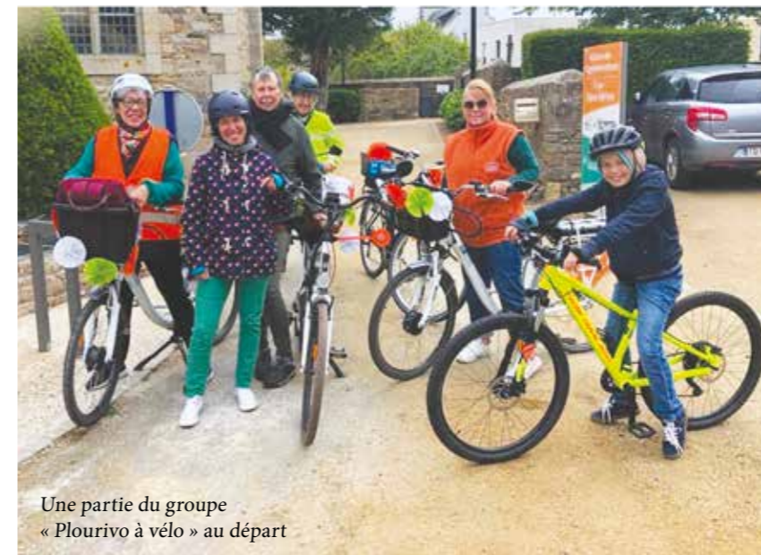
Une partie du groupe « Plourivo à vélo » au départ

Pour bien démarrer le printemps, et aussi pour la première fois, l'association Pays d'Paimpol à Vélo a décidé de rejoindre l'aventure du CHALLENGE TOUT À VÉLO organisée dans plusieurs villes bretonnes.