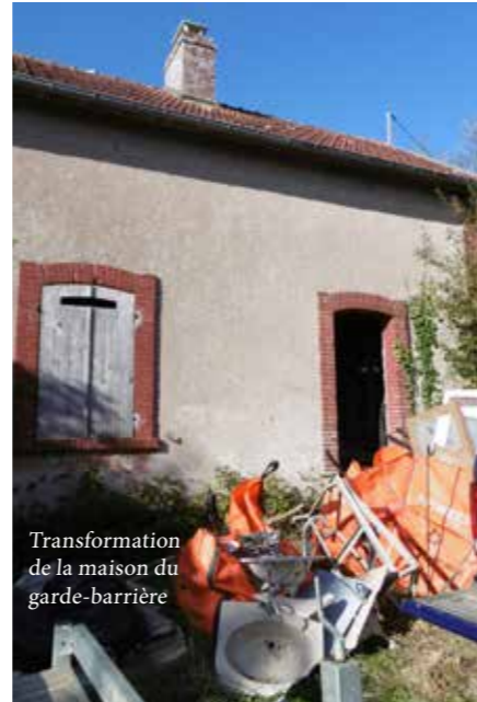
Transformation de la maison du garde-barrière

Des projets se situant sur des zones protégées par Natura 2000 peuvent être soumis à une évaluation d'incidence sur l'environnement. Qu'il s'agisse d'un aménagement sur un terrain ou d'une compétition sportive (nautique, ou dans la forêt par exemple), l'animateur Natura 2000 peut accompagner les usagers dans leurs démarches. Par ailleurs, certaines opérations (fauche de milieux ouverts, élimination ou limitation d'une espèce indésirable, création ou entretien de mares...) peuvent bénéficier d'une subvention Natura 2000, qui devient alors un levier d'action pour la vie sociale et économique.