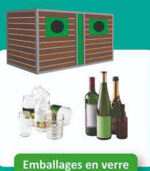
Embballages en verre

COLLECTE DU TRI EN VRAC INUTILE DE LAVER LES EMBALLAGES, IL SUFFIT DE BIEN LES VIDER Tous les emballages et papiers